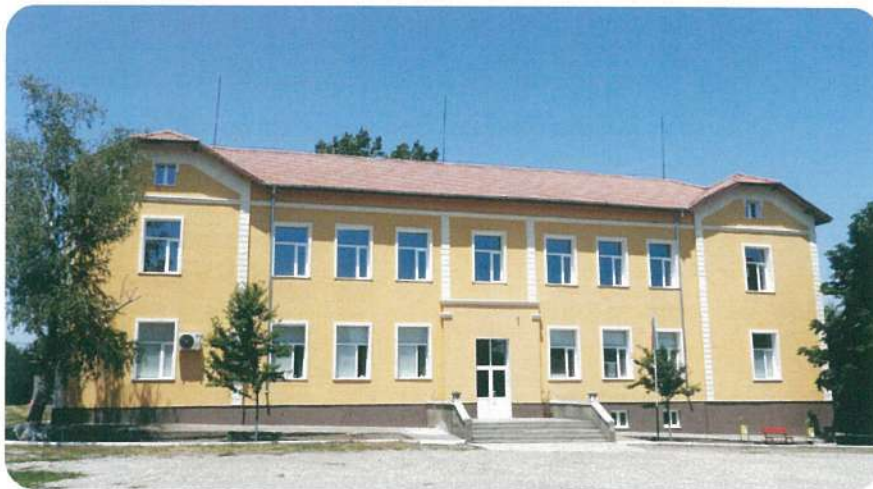
Въвеждане на мерки за енергийна ефективност в сградата на ОУ „Васил Левски“, с. Еница, общ. Кнежа

Изпълнителното бюро на Фонда продължава работата си със сравнително малък, но високоефективен екип, воден от високи професионални и етични стандарти. Повишаването на индивидуалните професионални знания, в т.ч. развитието и подобряването на компетентности и умения, свързани с управление на стреса, работа в екип, комуникационни умения и други, са в основата на ефективното прилагане на Мисията и Визията на НДЕФ.