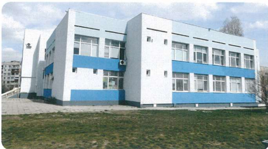
Реализиране на мерки за енергийна ефективност в сградата на 88 СУ „Димитър Попниколов“, гр. София