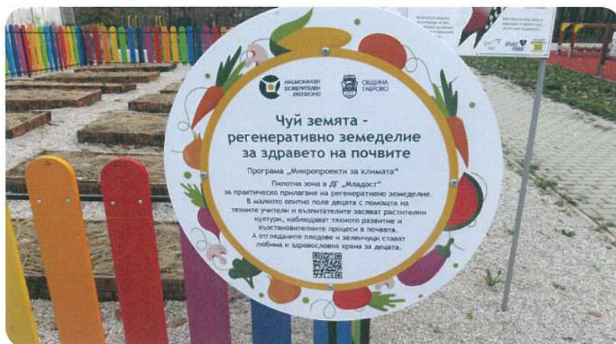
„Чуй земята – регенеративно земеделие за здравето на почвите“, пилотна зона в ДГ „Младост“, гр. Габрово

Паричните средства на НДЕФ се съхраняват по сметки на “Уникредит Булбанк” АД и Юробанк България АД. Към 31.12.2025 г. НДЕФ разполага по своите сметки с 42 579 хил. лв. Разпределението на паричните средства е представено в Приложение 5 .