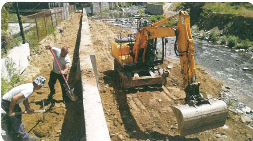
Основен ремонт на топлопровод за минерална вода от водоизточник, попадащ в ПИ с идентификатор 38844.101.95 по КК на гр. Костандово, общ. Ракитово, обл. Пазарджик