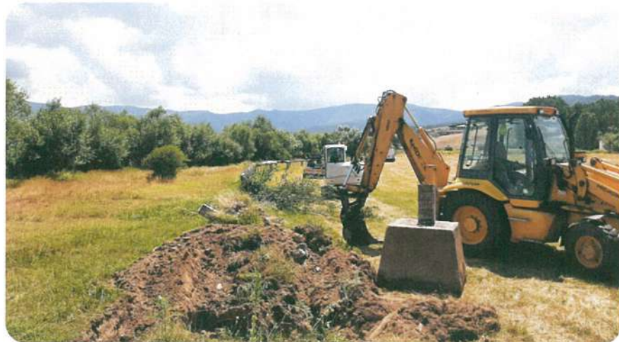
Уличен водопровод за минерална вода с дължина L 1300, с. Огняново, общ. Гърмен