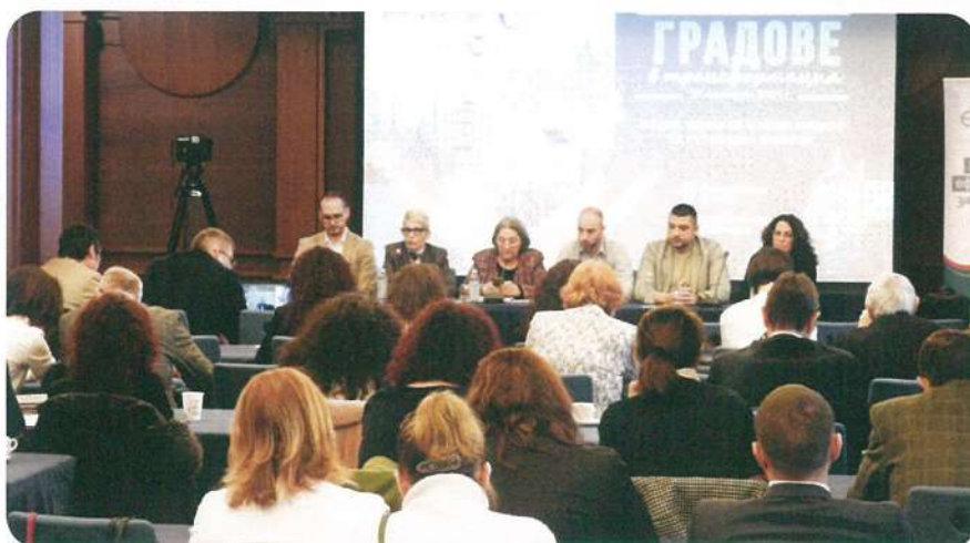
Инициатива NetZeroCities - XIX-а конференция „Градове в трансформация: стратегическа визия, решения за сградно обновяване, енергийни общности и нови умения“ на Асоциацията на българските енергийни агенции, съорганизирана от НДЕФ и Центъра за енергийна ефективност ЕнЕфект, гр. София