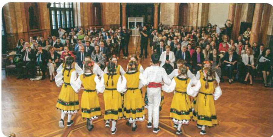
Тържествено събитие по случай 30-годишнината на НДЕФ, 02.06.2025 г., гр. София