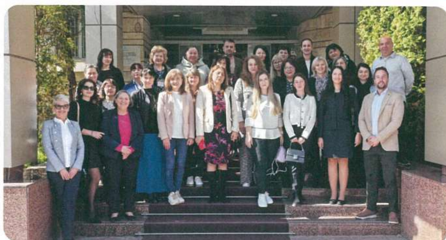
Национален семинар „Училищата в общината като лидери по пътя към климатична неутралност“, организиран от НДЕФ в рамките на проект „Визия 2045“, финансиран от Европейската инициатива за климата (EUKI) на Федералното министерство на икономиката и климата на Германия, гр. София