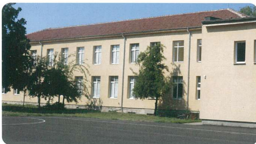
Прилагане на мерки за енергийна ефективност на ОУ „Отец Паисий“, гр. Мартен