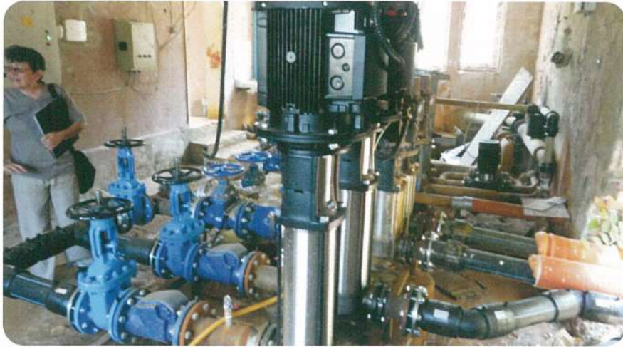
Оптимизиране начина на водовземане на разрешителен режим на минерални води от сондаж № СН-ЗВП чрез изграждане на нов водопровод, ремонт на съществуващи резервоари и изграждане на разпределителна мрежа – II етап, подобект А, с. Минерални бани